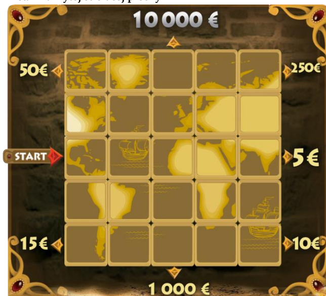
Detail zakrytej stieracej plochy