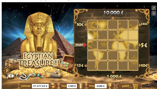
Vzor žrebu so zakrytým hracím poľom: