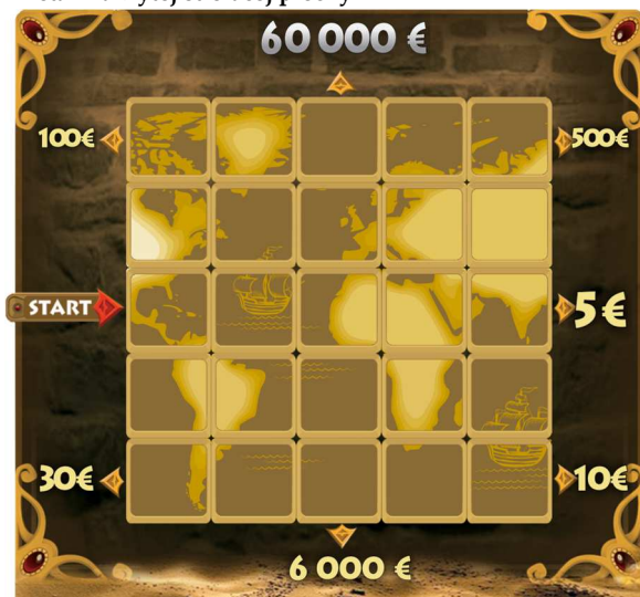
Detail zakrytej stieracej plochy